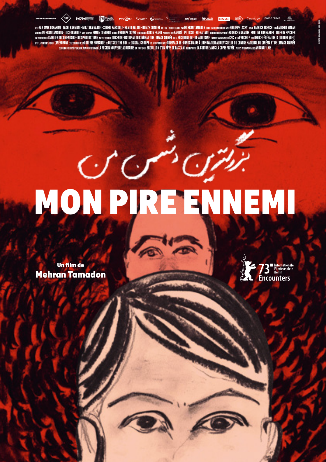
ILLUSTRATION: MEHRAN TAMADON