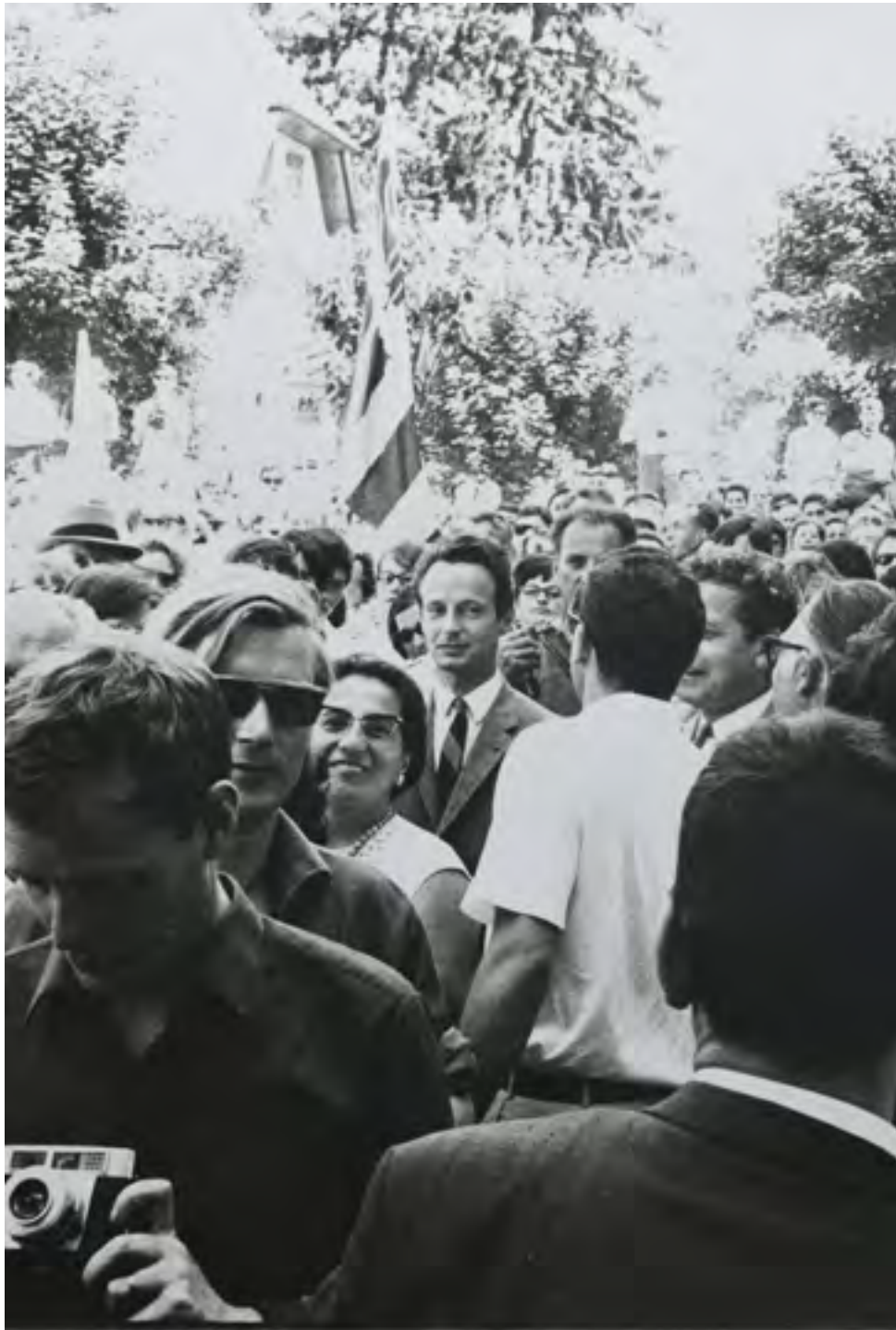
Béguelin (au centre) et la jeunesse jurassienne, 1968, © Marcel Hêche / Galerie du Sauvage

Concrètement, je me suis battu entre autre activement contre la suppression de l'école d'Undervelier-Soulce, j'ai vécu la fusion de la Haute-Sorne, aujourd'hui la question de la Géothermie à Glovelier, où pour le moins l'Etat communique mal, le manque drastique de moyens pour la culture, etc... Tout cela en comprenant jusqu'à un certain point les difficultés de notre petit canton.