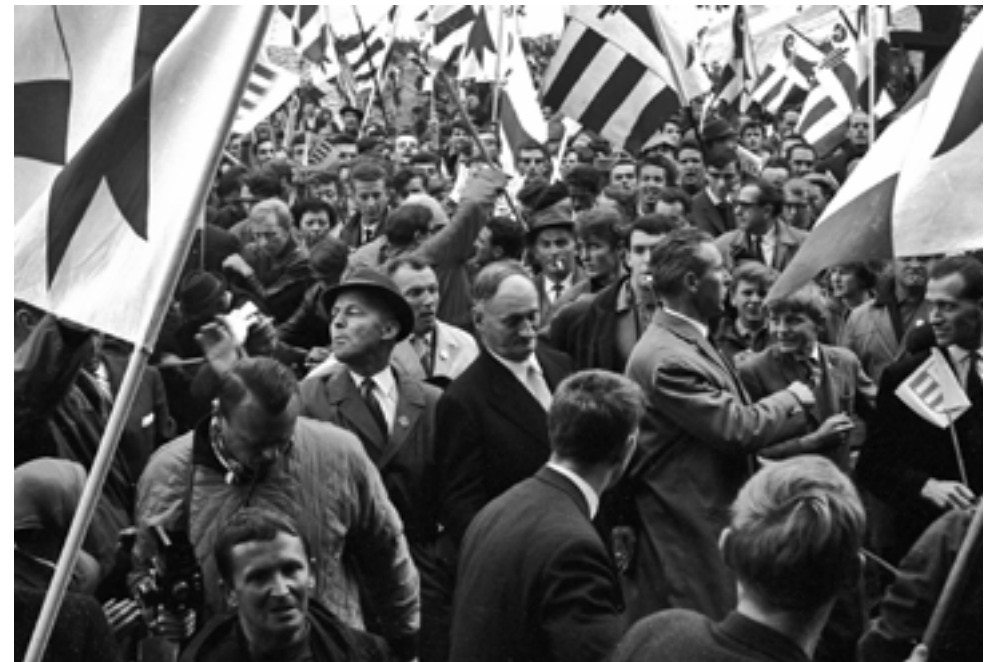
Les Rangiers, 1964, © Bernard Willemin / Galerie du Sauvage

Le 23 juin 1974, une majorité de votants dans les sept districts accepte la création d'un Canton du Jura. Le 16 mars 1975, les districts de Courtelary, Moutier, La Neuveville et Laufon, décident de rester bernois. En septembre, dans un troisième temps, des communes limitrophes votent leur rattachement au Canton du Jura.